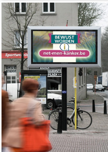
Ledscherm op straat