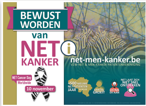
Affiche NET Kanker Dag, gedrukt of om zelf te printen